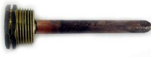
Κυάθια I – III